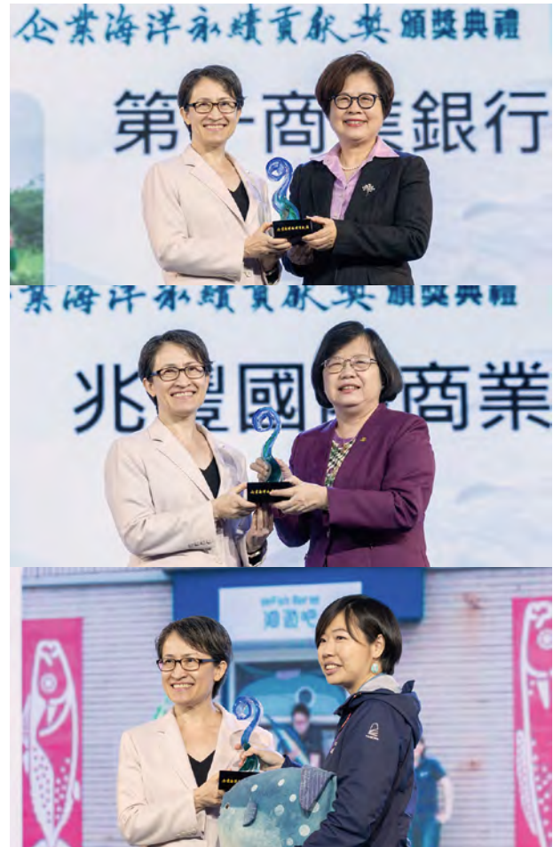
上 蕭美琴副總統與得獎企業團體第一商業銀行代表合照。 圖 / 總統府。

蕭副總統說明，相信得獎企業不只是為了符合 ESG（Environment 環境、Social 社會、Governance 公司治理）指標、評比分數及因應政府的監理管制，而是發自內心對地球的責任感及對海洋的熱愛，且認同海洋永續對臺灣的重要性。政府也會持續與大家一起合作，積極推動海洋政策、海洋治理並加強與國際合作，因應氣候變遷的挑戰，期盼能整合學術、產業及公民的力量，共同打造「與海共生、與海共榮」的永續國家。最後，蕭副總統再次恭喜得獎的企業團體，相信未來將有更多需要承擔的責任，也會有更多企業以得獎企業為榜樣，持續投入海洋永續的行列，為臺灣打造更好的海洋永續環境，一起繼續守護海洋、強化臺灣人民與海洋的連結。