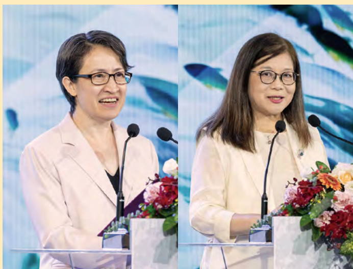
上 蕭美琴副總統致詞。圖 / 總統府。 下 管碧玲主委致詞。圖 / 總統府。

海洋委員會及海洋保育署為了表揚公司企業及民間團體，對於推動海洋永續行動的服務與貢獻，分別於 11 月 12 日在臺北 101 大樓舉辦首屆「企業海洋永續貢獻獎」頒獎典禮，以及 11 月 1 日在臺北士林國立臺灣科學教育館舉辦「海洋永續行動大賞」。「企業海洋永續貢獻獎」頒獎典禮邀請副總統蕭美琴親自頒獎，與得獎企業代表及現場貴賓共同見證榮耀時刻，象徵政府與企業攜手守護海洋的決心。