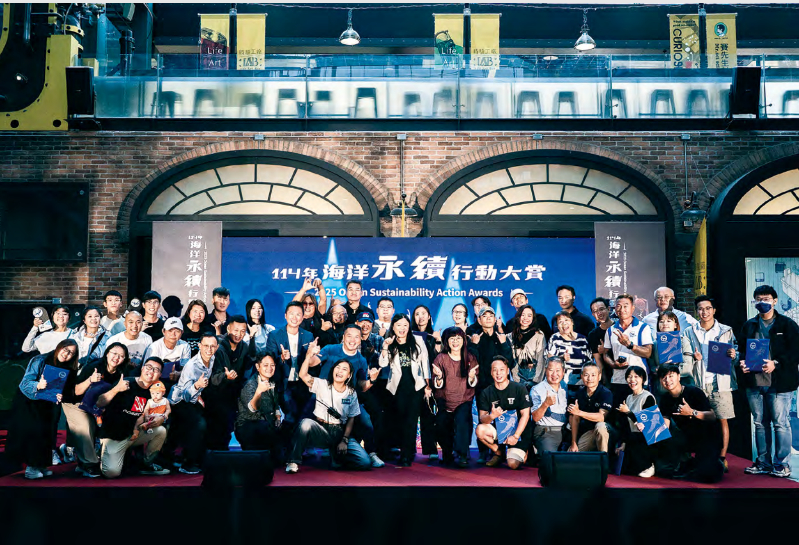
114 年「海洋永續行動大賞」頒獎典禮大合照。

海洋委員會及海洋保育署表示，再次向所有支持海洋永續的企業及民間團體表達誠摯的謝意，每一份對海洋的努力與付出，都值得被看見與肯定，海洋委員會及海洋保育署未來將持續和企業、民間團體以及各界夥伴一起努力，推動各種海洋永續行動，「企業海洋永續貢獻獎」及「海洋永續行動大賞」的推動，要讓更多企業及民間團體將守護海洋視為永續發展的重要核心，使其成為企業文化的一部分，當企業行動與社會責任同行，海洋將更加潔淨，生態更加豐富。