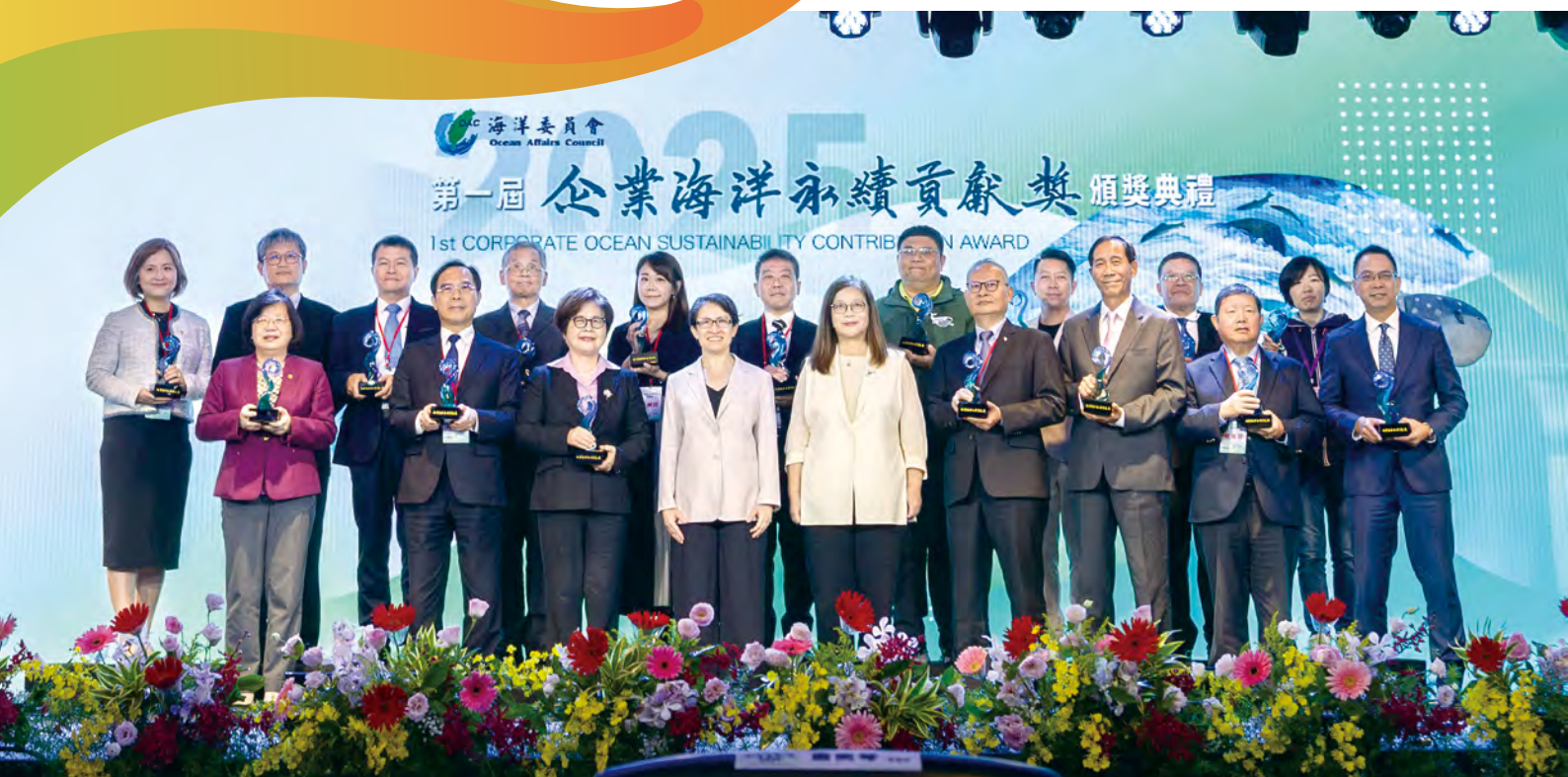
第一屆「企業海洋永續貢獻獎」頒獎典禮大合照。